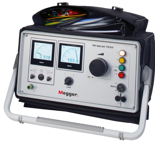
模拟式 / 数字式控制单元 50/80/110/120 kV

SALES OFFICE Megger Limited Archcliffe Road Dover CT17 9EN England T +44 (0) 1304 502101 E UKsales@megger.com